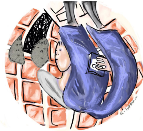
Pérez Castellanos, Paola Quetzalli. (2023) Reunión , Ilustración digital.