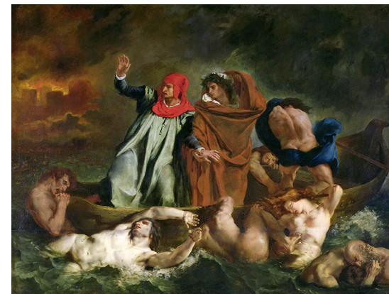
Delacroix, E. (1822). La barca de Dante [óleo sobre lienzo]. Museo del Louvre.

ejemplos) o bien como se transcriben dichos signos a partir de una escena similar realizada por otros artistas, aún en diferentes épocas, y quizá también en otros lenguajes no plásticos (por ejemplo, la importación o “transcripción” de una