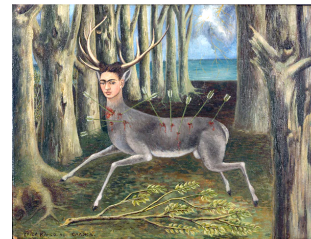
Kahlo, F. (1946). El venado herido [óleo sobre tabla]. Colección particular. Nota. La mascota herida de la pintora hace alusión a su cuerpo quebrantado por el deterioro y el sufrimiento, tal sustitución planteada por la artista es un buen ejemplo de metonimia visual.

que posibilitan a su público el conferirles un sentido en un ejercicio interactivo (Agudelo, 2015). En otras palabras, las imágenes artísticas pueden concebirse con una intención de comunicar algo a su público a través de una representación del mundo, o mejor dicho, de una intención de decir algo acerca de él. Esta representación está constituida por signos que operan bajo reglas y estrategias de elaboración dentro de la especificidad de un medio plástico, ya sea pictórico, gráfico o fotográfico. Este conocimiento es el primer paso para una apreciación que permita poner en juego el análisis de los elementos que constituyen la imagen artística y sus reglas operativas, para construir un discurso a través de signos, que puede construir formas retóricas como la metáfora o la