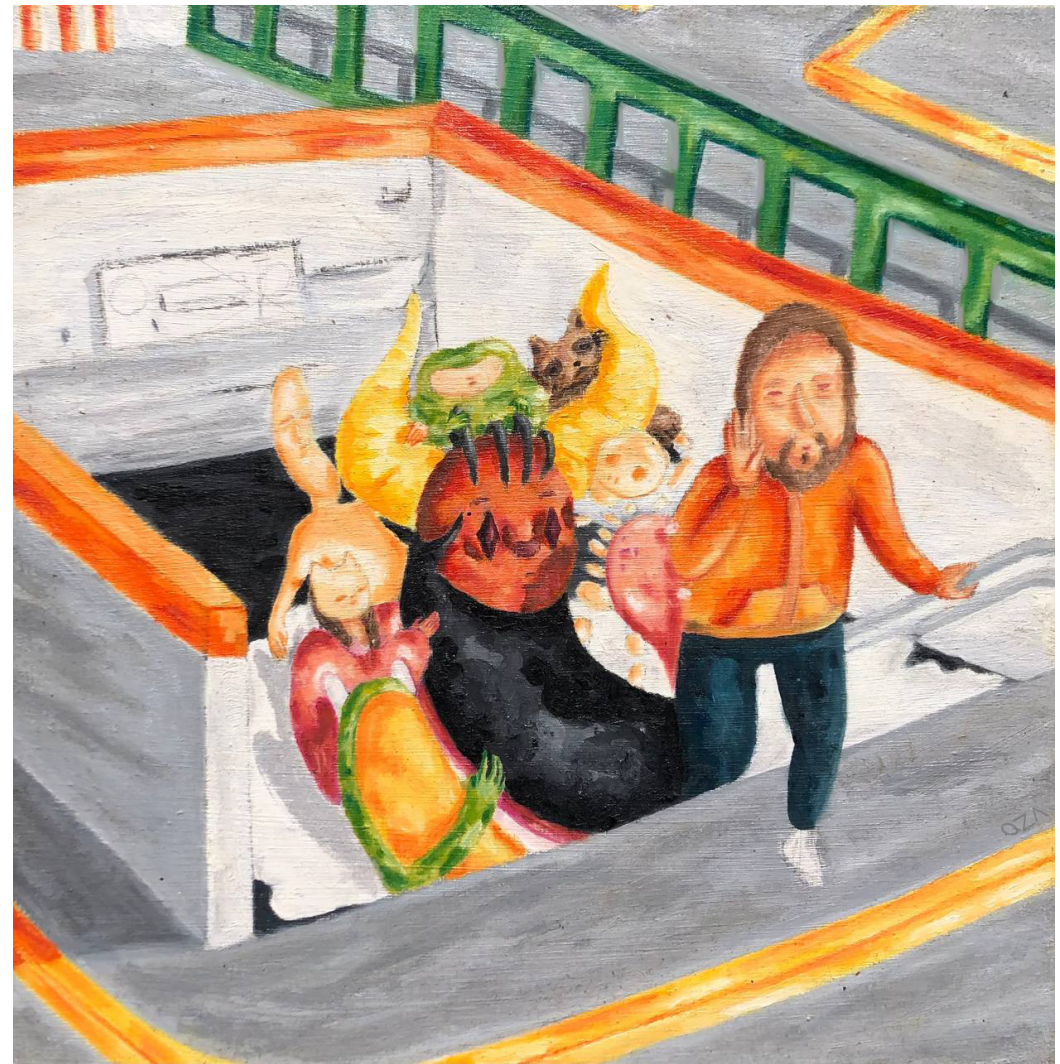
Pérez Castellanos, Paola Quetzalli. (2020) Salida , Ilustración digital.

Tal vez nuestra generación no sea como aquellas de grandes personajes, quizá ya no tenemos la capacidad de escribir las grandes obras científicas, literarias ni filosóficas de antes, tal vez ni siquiera conocemos los lugares donde estos grandes acontecimientos sucedían; pero en las aulas de la Escuela Nacional Preparatoria seguimos contando esa historia; la cuentan los profesores desde sus diferentes disciplinas y formaciones académicas. Historias como la del Quijote que nos invita a seguir creyendo que la cultura y nuestro país serán mejores con esos relatos que se transmiten ENPalabras, y ojalá que, una vez más, con eso sea suficiente.