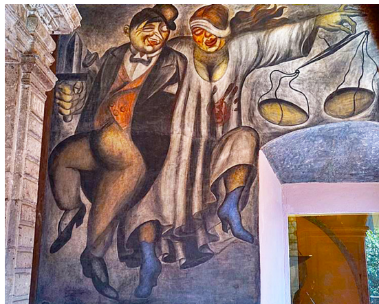
Orozco, J.C. (1923). La ley y la justicia [mural al fresco]. Antiguo Colegio de San Ildefonso.

atención y entender como los llamados elementos diferenciales devienen en signos icónicos con una función comunicativa (Ver tabla 1). Dichos signos permiten comprender cómo se construye una escena pictórica para orientar su significado (a través de los encuadres, el punto de vista, la iluminación o características de los personajes retratados, por citar algunos